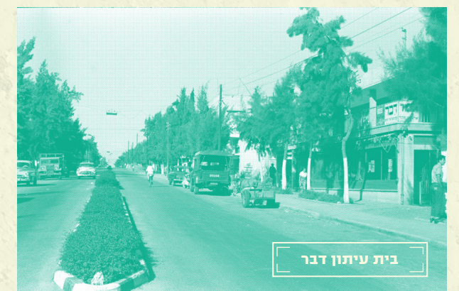
בית עיתון דבר

כבר בראשית המושבה, נפתח בית מרקחת של הרוקח סלור על רחוב ויצמן. לרווחתם של תושבי המקום, נפתח בית מרקחת כנרת בו מספרים התושבים שאת תרופות המזור למחלתם, רקחו במקום.