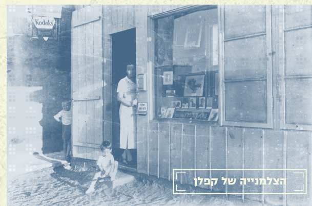
הצלמנייה של קפלן

הבנין בין 3 קומות נבנה בסוף שנות ה-20, בסגנון ה"באוהאוס", ע"י שמואל ולד. על גג הבנין הגבוה הוקמה תחנת קשר בנושאי ביטחון ליישובי הסביבה, שפעלה בלילה באמצעות פנסי איתות..