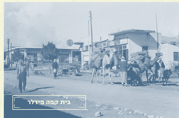
בית קפה פידלר